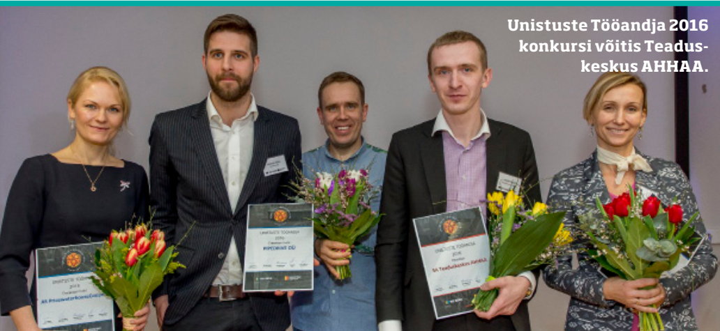
Unistuste Tööandja 2016 konkursi võitis Teadus- keskus AHHA.